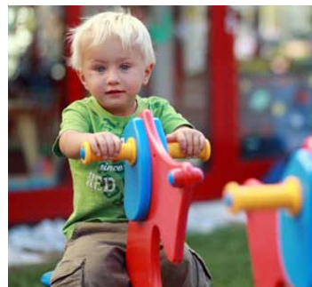
Kinderbetreuung durch geschultes Personal wird vom OptimaMed Gesundheitsresort Oberzeiring angeboten.