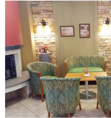
Gemütliche, entspannte Atmosphäre